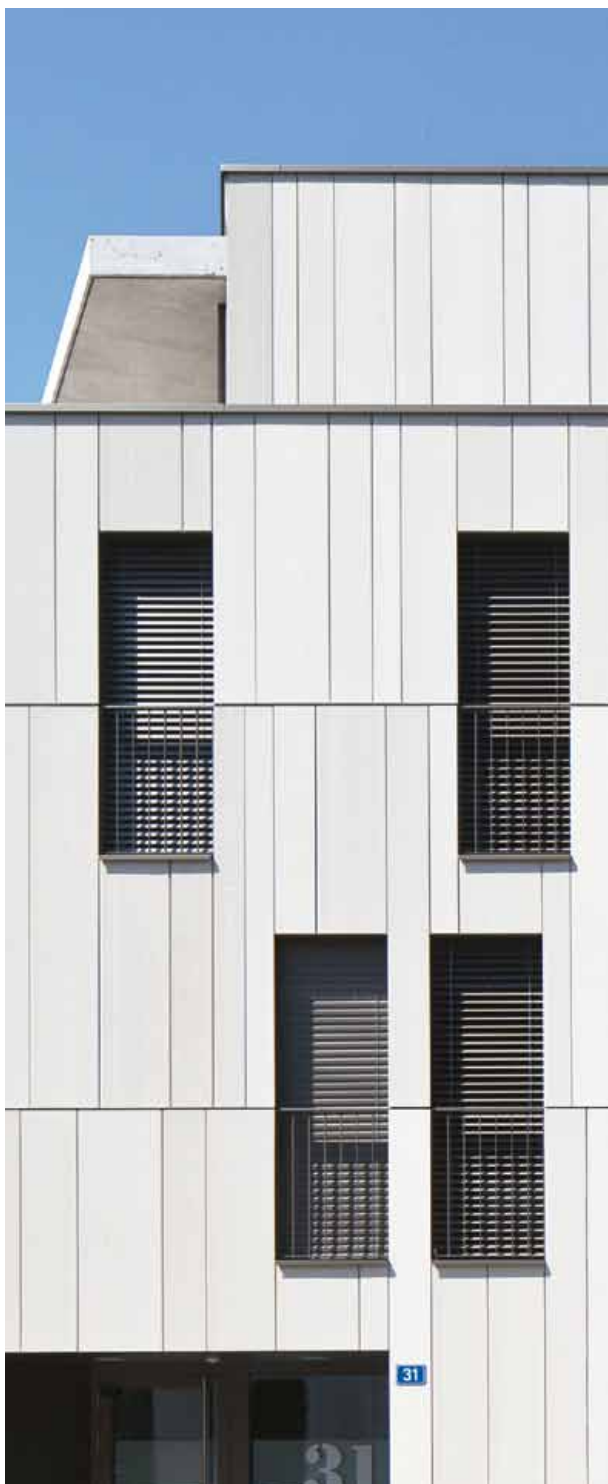
Vertikal montierte Terracotta-Platten, am Halbgeschoss ausgerichtet

In Gehdistanz von Schule und Einkaufsmöglichkeiten liegt der Wohnpark für generationenübergreifendes Wohnen. Die genossenschaftlich getragene Überbauung bietet Wohnraum für Familien und Senioren. Reduziert auf drei ähnliche Gebäudeformen bilden acht freistehende Gebäudekörper die Neubausiedlung. Durch Drehung und Spiegelung des sieben- und achteckigen Grundrisses haben Rapp Architekten eine optische Vielfalt und unterschiedliche Wohnungsausrichtungen erzielt.