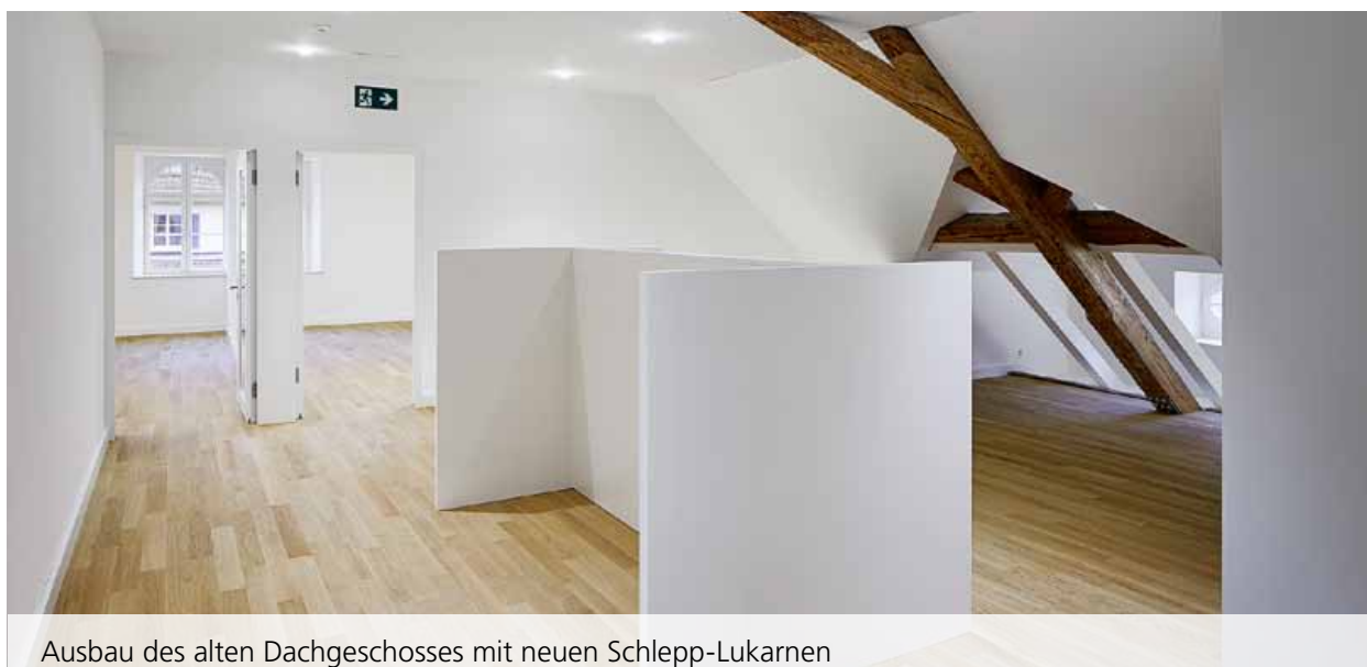
Ausbau des alten Dachgeschosses mit neuen Schlepp-Lukarnen

Einst als Armenhaus gebaut, wurde der geschichtsträchtige Altbau während vielen Jahren auch als Schulgebäude genutzt. 1912 folgte die Umfunktionierung zum Grundbuchamt und ein paar Jahre später der Einzug des städtischen Kindergartens. Nach einer Renovation im Jahre 1924 wurde das historische Gebäude nach und nach den aktuellen Bedürfnissen angepasst. Heute erstrahlt das «Zentrum Hinterer Wasen» in neuem Glanz und beherbergt den Gemeindeverband Bezirk Laufenburg. Der Umbau vereint alt und neu und hat dem Quartier neues Leben eingehaucht.