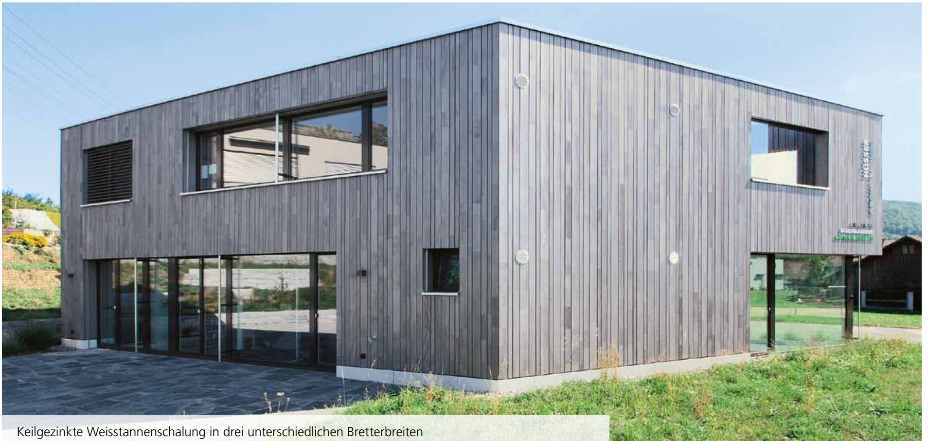
Keilgezinkte Weisstannenschalung in drei unterschiedlichen Bretterbreiten

Markant steht der zweigeschossige Büroneubau an prominenter Lage im Zentrum von Frick. Im Erdgeschoss sind das Architekturbüro von Bauherrn René Hüsser sowie das Büro für Gartenarchitektur von Markus Hüsser angesiedelt. Vater und Sohn lassen hier Wohn- und Gartenträume wahr werden. Eine 2,5-Zimmer-Wohnung mit grosser Loggia bildet das Obergeschoss. Der naturnahe Garten als verbindendes Element zwischen Büro- und benachbartem Wohngebäude fällt auf durch Eleganz und Einfachheit. Hier trifft man sich – ein Genusssort für die Bewohner des Mehrfamilienhauses aber auch für die beiden Architekten und Ihre Besucher.