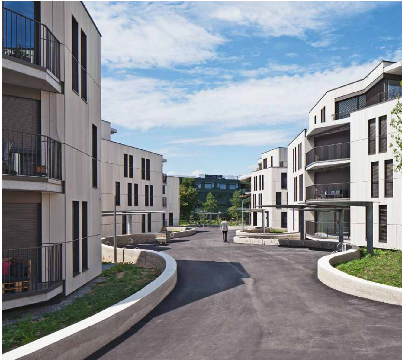
Optische Vielfalt durch Drehung und Spiegelung des vieleckigen Grundrisses

Am Kohlistieg in Riehen realisierte die Wohnbau-Genossenschaft Nordwest eine Wohnüberbauung mit 98 Wohnungen im Baustandard Miner- gie-P. Stilvoll und modern umhüllte HUSNER alle acht Mehrfamilienhäuser mit cremeweissen Terracotta-Platten.