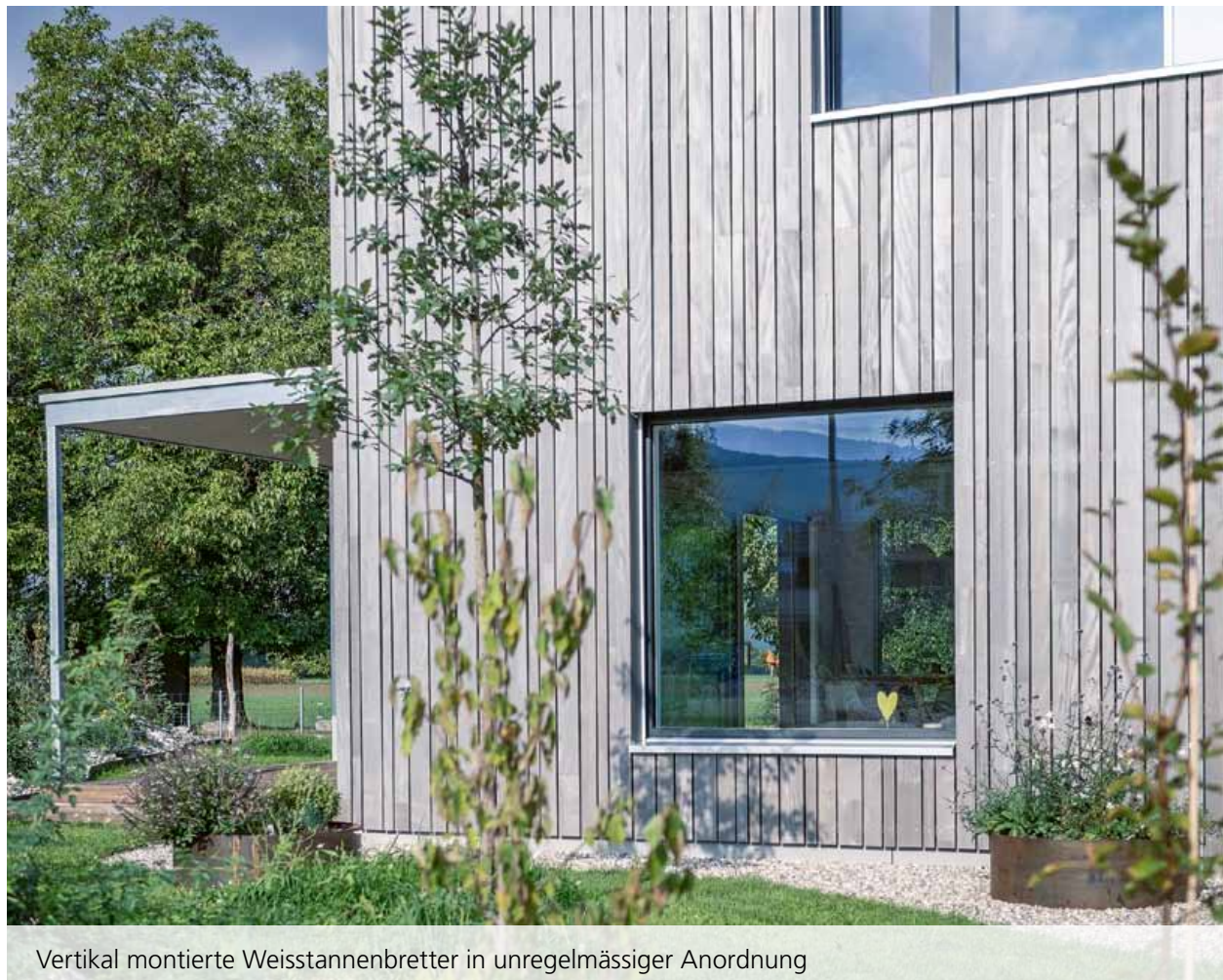
Vertikal montierte Weisstannenbretter in unregelmässiger Anordnung

Die filigranen Dachabschlüsse aus Chromstahl sind zurückhaltend ausgeführt, so dass sie kaum sichtbar sind und die Holzfassade ungestört wirken kann.