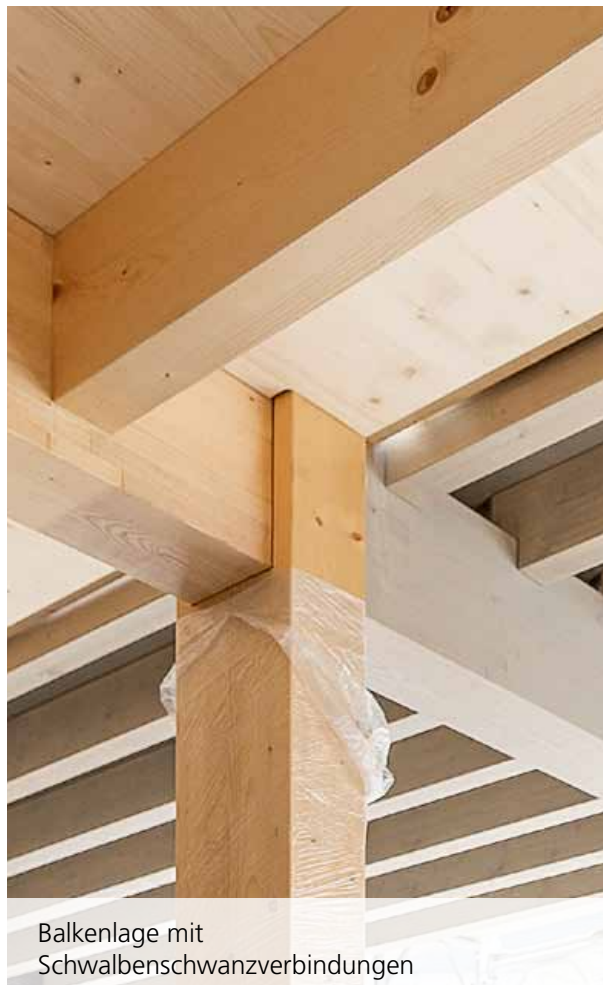
Balkenlage mit Schwalbenschwanzverbindungen

MR: Mit dem Ingenieur haben wir unterschiedliche Decken punkto Kosten, Aufbau und Wirkung verglichen. Die Balkenlage als einfachste Deckenkonstruktion überzeugte im Preis, ist akustisch und atmosphärisch sehr interessant und entfaltet sich insbesondere in kleinen Räumen durch die besondere Raumhöhe. Somit bietet sie eine durchwegs spannende Alternative zu flächigen Holzdeckensystemen.