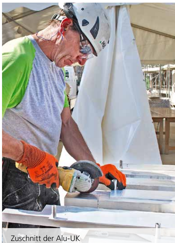
Zuschnitt der Alu-UK