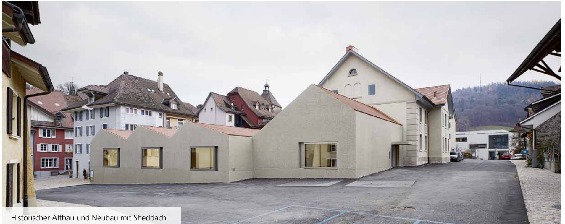
Historischer Altbau und Neubau mit Sheddach

Das unter Denkmalschutz stehende «Alte Grundbuchamt» in Laufenburg aus dem Jahre 1834 steht auch nach dem Umbau wieder im Dienste der Öffentlichkeit.