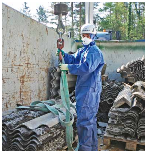
Fachgerechter Rückbau und Entsorgung asbesthaltiger Faserzementelemente

Asbesthaltige Faserzementelemente von glatter und gewellter Oberfläche sowie Beton aus den späten sechziger Jahren umhüllten bis vor ein paar Monaten das Betriebsgebäude an der Hardmatt in Kaisten. Die