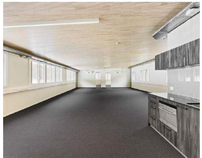
Neubau Bürogebäude, Densbüren

Eine Projektidee in ein planungsreifes Bauprojekt zu überführen, ist eine komplexe Aufgabe. Wir sehen es als unsere zentrale Rolle, Sie bei der Erstellung der Strategie, Machbarkeitsstudie und Wirtschaftlichkeitsberechnungen zu unterstützen. HUSNER prüft die Möglichkeiten hinsichtlich Potential, Lage aber auch gesetzlichen Bestimmungen, mit dem Ziel, gemeinsam mit Ihnen die beste wirtschaftliche Lösung für Ihr Bauvorhaben zu finden. Unsere Spezialisten entwickeln die Architektur oder wir arbeiten in Kooperation mit Ihrem Architekten.