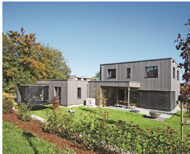
Neubau Schulhaus Mellingen | Neubau EFH, Gipf-Oberfrick | Neubau EFH, Leibstadt