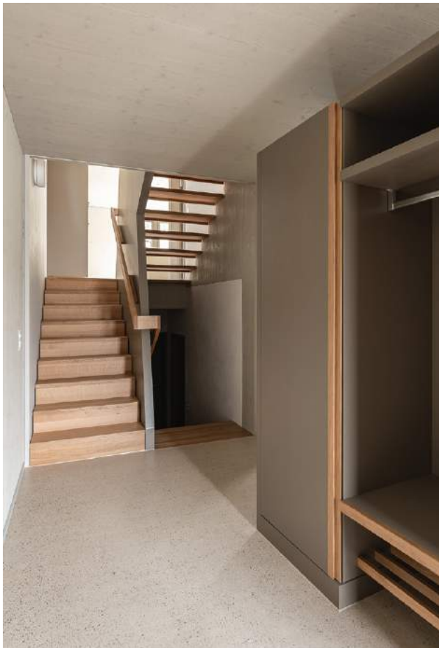
Neubau Arealüberbauung «Leben im Park», Gipf-Oberfrick

Als finanzgesunde Gesamt- und Totalunternehmung realisiert HUSNER hochwertige Immobilien in Holzbauweise für den Verkauf. Architektur und Design sind uns ein zentrales Anliegen. Auf das qualitative Raumerlebnis legen wir genauso Wert wie auf ein faires Kosten-Nutzen-Verhältnis. Unsere Kundschaft soll ein Optimum an «Wohnen» erhalten und sich in ihren Räumen wohlfühlen. Von Anfang an steht Ihnen unser Projektleiter zu Seite. Er koordiniert den gesamten Bauablauf, nimmt sich Zeit für Ihre Fragen und kümmert sich um Ihre Wünsche. So, dass Ihr neues Daheim Ihren Vorstellungen entspricht.